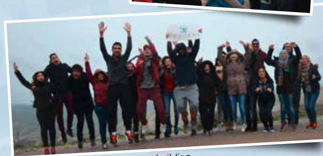
Activités sportives et de team building