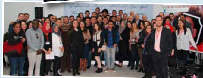
Conférences animées par des professionnels