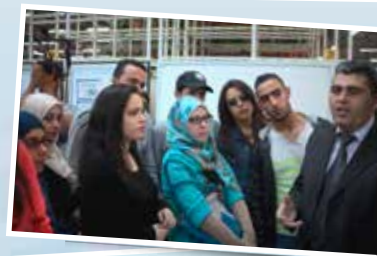
Ouverture à l'environnement et visites d'entreprises