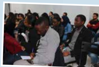
Ouverture de la Faculté sur l'Afrique subsaharienne