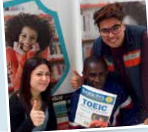
Ateliers de préparation aux certifications