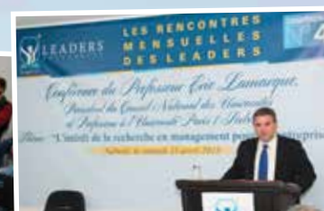
Un conférencier de la Sorbonne à Leaders University

Ministère de l'Enseignement Supérieur et de la Recherche Scientifique